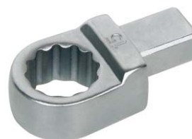
梅花扳手头部(选配)