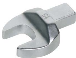
开口扳手头部(选配)