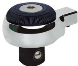
备用棘轮头部(选配)