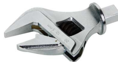
可调开口扳手头部(选配)